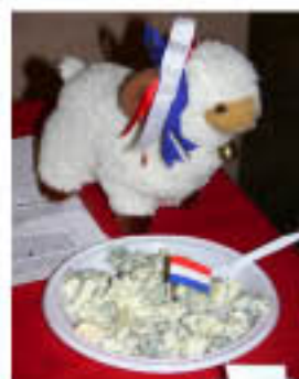
Due simpatiche immagini della Serata sul "Formaggi francesi"

I convivii serali, con approfondimenti enogastronomici e culturali del Mondo, seguiti da stuzzicanti degustazioni di prodotti tipici denominati "Serate a tema", hanno già vissuto in questo Anno Accademico tre momenti. Il primo, a dicembre, è stato dedicato ai Paesi Scandinavi, poi il 7 gennaio è stata la volta dei Formaggi francesi, mentre l'11 febbraio si è parlato di India. Il prossimo appuntamento è fissato per il 17 marzo, con l'intrigante serata dal titolo "Mangia, bevi e sii felice": un affascinante viaggio nei suggestivi scenari del mondo caraibico, con i suoi colori e sapori. Mentre il 14 aprile sarà la volta dei "Sapori di Sardegna". Tutte le Serate a tema si svolgono di lunedì, presso il Circolo Sardo "G. Dessì" (C.so Papa Giovanni Paolo II, 31 – Strada Casale). La partecipazione è aperta a tutti. E' obbligatoria la prenotazione presso la Segreteria dell'UniPop (0161/56.285).